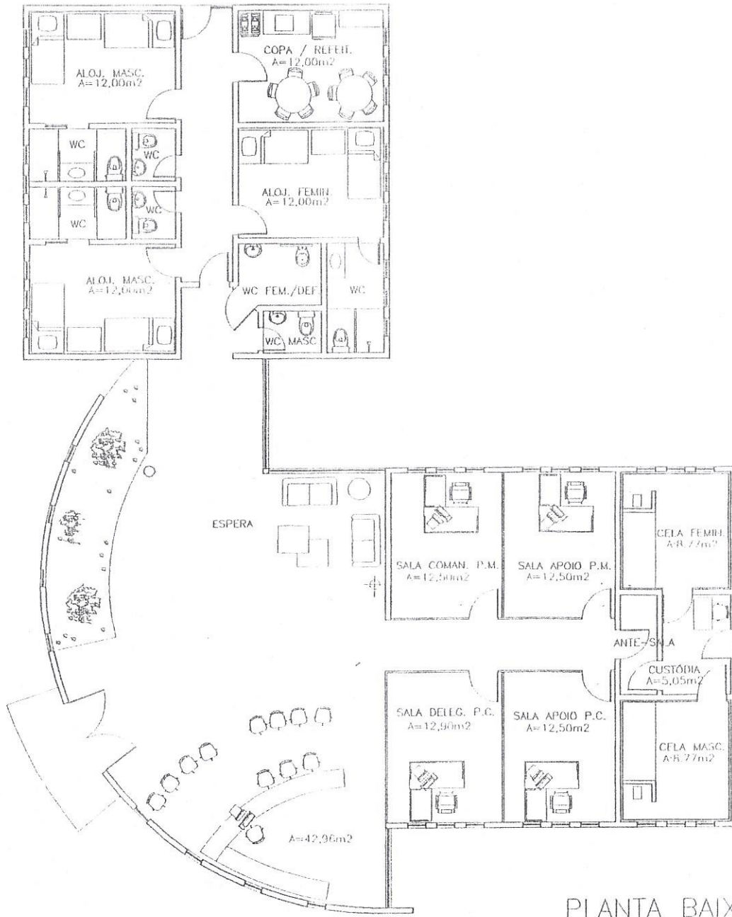
PLANTA BAIXA ESC 1:150