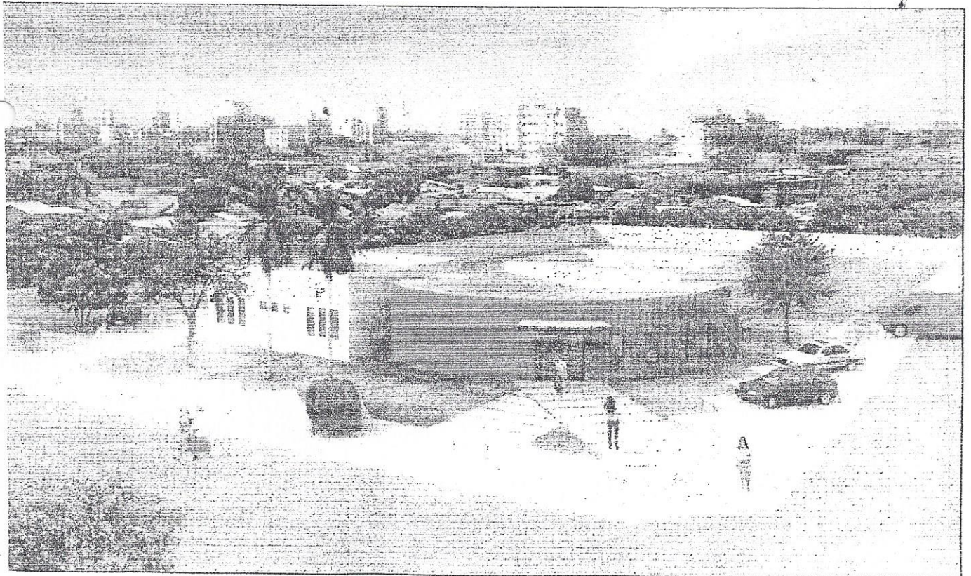
SI - UNIDADES DE SEGURANÇA INTEGRADA - PEQUENO PORTE