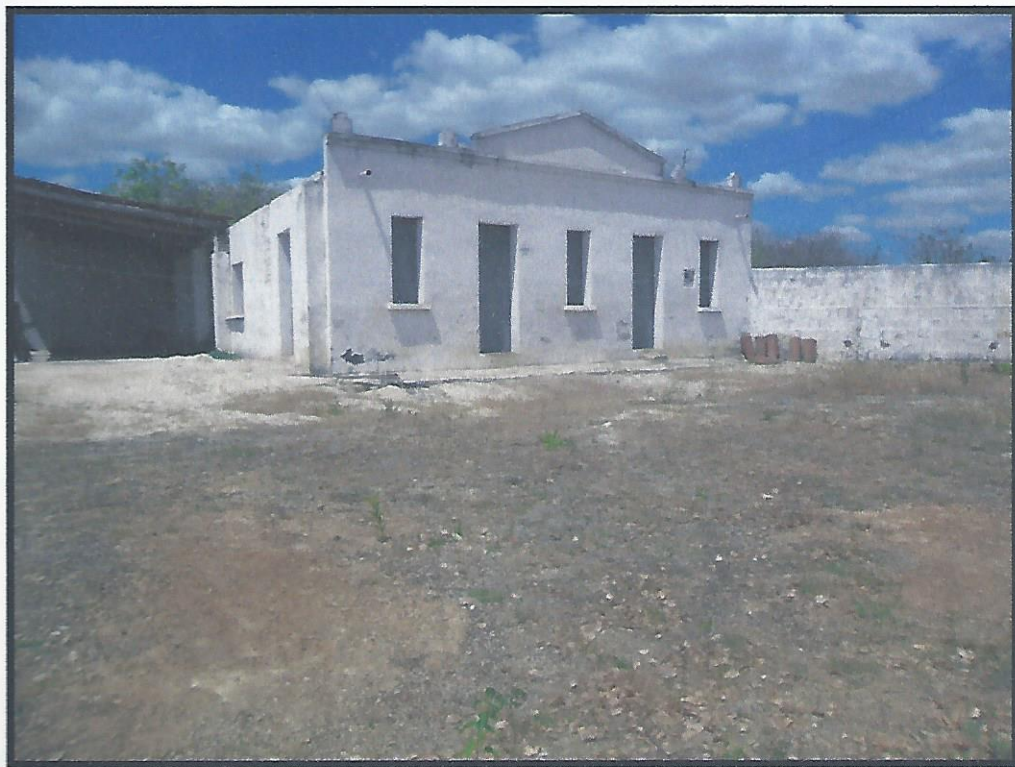
Imagem do Casarão no Saco Verde-Tabuleiro do Norte

Em suma, homem simples e trabalhador muito fez por esta cidade, partiu jovem, porém deixou uma família composta de 58 netos e 82 bisnetos aos quais a maioria se tornaram cidadãos tabuleirenses.